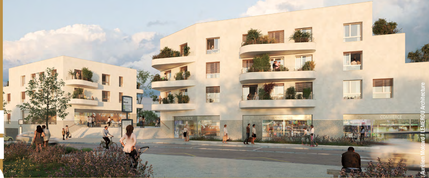
Illustration : Aurélien Molcard / LEMEROU Architecture