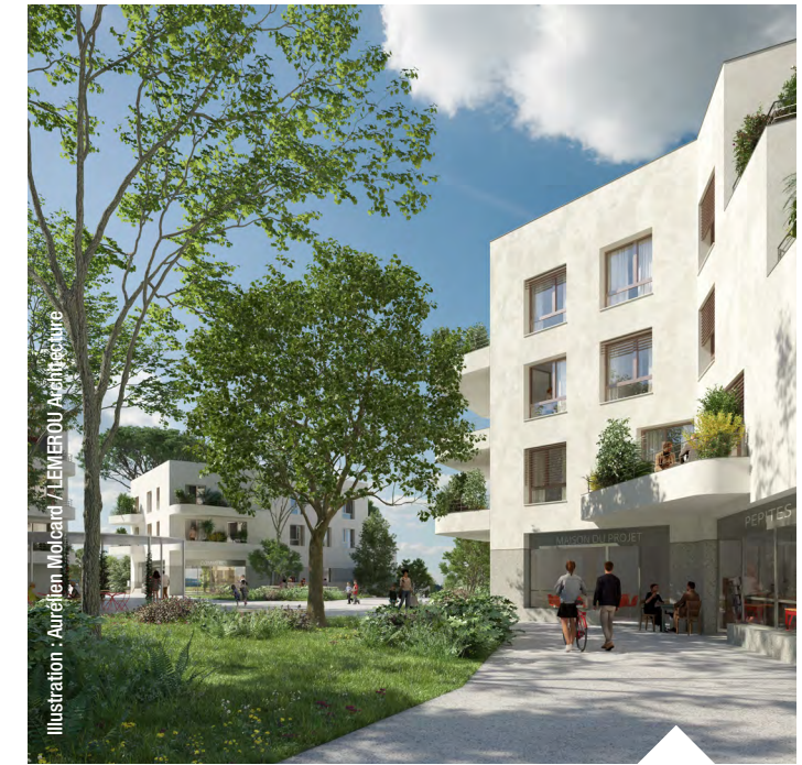
Illustration : Aurélien Molcard / LEMEROU Architecture